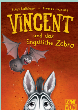
Coverabbildung: ©Loewe Verlag